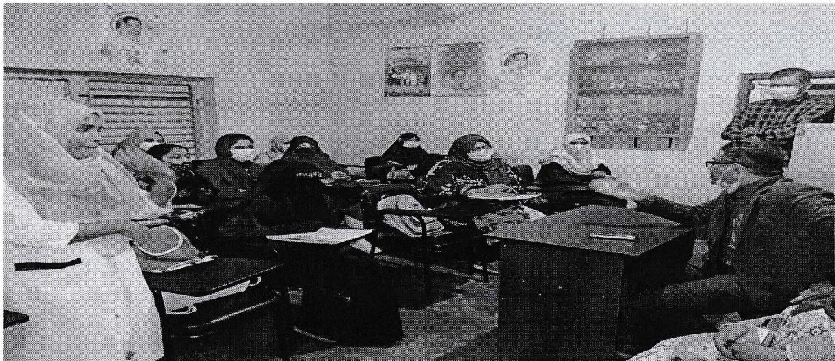
জাতীয় মহিলা সংস্থা, চট্টগ্রাম প্রশিক্ষণ কেন্দ্র পরিদর্শন চিত্র

বিগত ২৩/১১/২০২১ তারিখ বেলা ২.০০ ঘটিকায় আমি জাতীয় মহিলা সংস্থা, চট্টগ্রাম এর জেলা কার্যালয় পরিদর্শন করি। পরিদর্শনকালে জেলা কর্মকর্তা, সকল স্তরের কর্মকর্তা/কর্মচারীবৃন্দ ও চলমান ০৩ (তিন) টি কোর্সের প্রশিক্ষণার্থীবৃন্দ উপস্থিত ছিলেন। এছাড়া জেলাভিত্তিক মহিলা কম্পিউটার প্রশিক্ষণ প্রকল্পের সহকারী প্রোগ্রামার ও প্রশিক্ষক নিম্নস্বাক্ষরকারীর সহযোগী হিসেবে ছিলেন। প্রশিক্ষণার্থীদের সাথে মতবিনিময় করা হয়, তাদের প্রশিক্ষণ অগ্রগতি, প্রশিক্ষণের মান যাচাই করা হয়। প্রশিক্ষণ শেষে তাদের লব্ধ জ্ঞান পরবর্তী জীবনে ব্যবহারের নিমিত্ত ভবিষ্যৎ পরিকল্পনা নিয়ে মতামত ও পরামর্শ প্রদান করা হয়। সার্বিক কার্যক্রম খুবই সন্তোষজনক মর্মে প্রতীয়মান হয়। অত্র কেন্দ্রের কার্যক্রম আরো বেশী জনগনকে অবহিত এবং সঠিক তথ্য প্রদানের লক্ষ্যে প্রচার বাড়ানো এবং কেন্দ্রের প্রবেশ মুখে হেল্পডেস্ক স্থাপনের পরামর্শ দেয়া হলো।