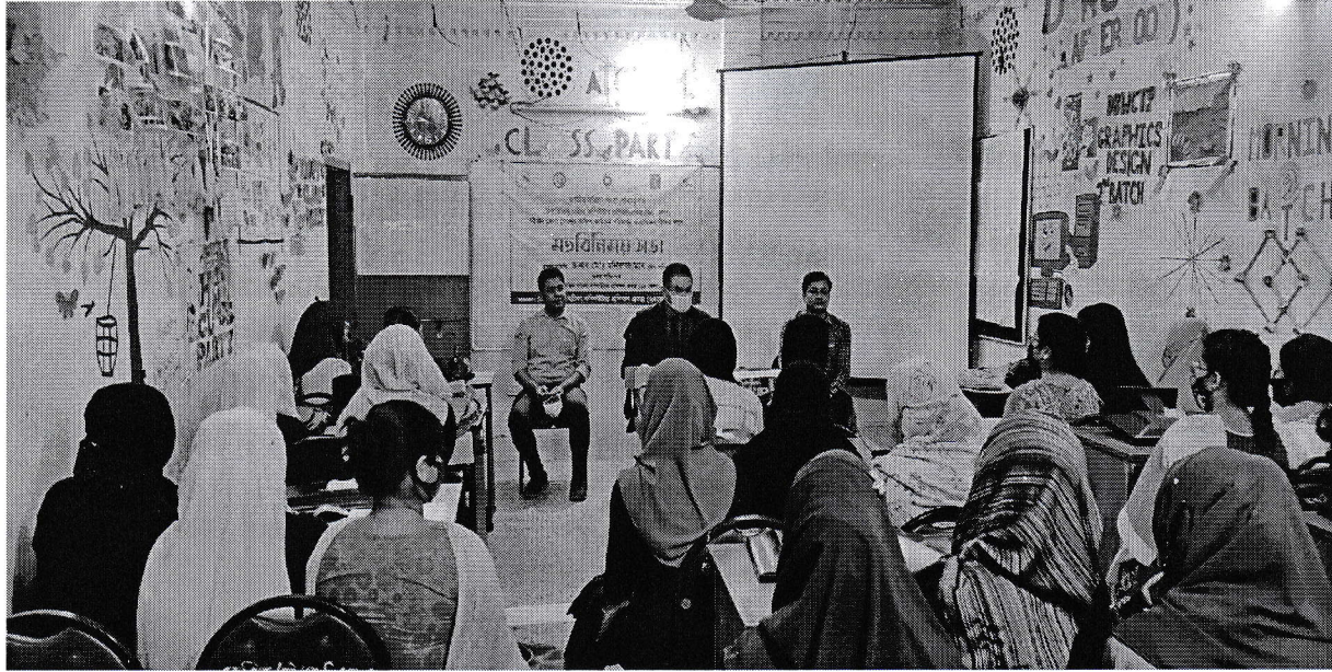
প্রকল্পের চট্টগ্রাম জেলা প্রশিক্ষণ কেন্দ্র পরিদর্শন চিত্র

সার্বিক বিবেচনায় কার্যক্রম সুষ্ঠুভাবে পরিচালিত হচ্ছে মর্মে প্রতীয়মান হয়েছে। সুষ্ঠু অফিস ব্যবস্থাপনায় প্রয়োজনীয় পদক্ষেপ গ্রহণ করার পরামর্শ দেয়া হয়। প্রশিক্ষণে সংশ্লিষ্ট সকলকে প্রশিক্ষণ প্রদানের ক্ষেত্রে শতভাগ আন্তরিক থাকতে হবে। নির্ধারিত সময়ের মধ্যে বাংলাদেশ কারিগরি শিক্ষাবোর্ডের সিলেবাস শেষ করতে হবে। ল্যাব রুমসহ অন্যান্য কক্ষ পরিষ্কার পরিচ্ছন্ন রাখতে হবে। হেল্পডেস্ক স্থাপনের প্রয়োজনীয় ব্যবস্থা গ্রহণ করলে দ্রুত তথ্য প্রদান নিশ্চিত হবে। প্রধান কার্যালয় থেকে প্রাপ্ত যন্ত্রপাতি ও মালামাল সংগ্রহের তারিখসহ রেজিস্টারে সংরক্ষিত নেই এবং মালামালের উপর প্রকল্পের নাম পাওয়া যায়নি যা বিধি অনুযায়ী সংরক্ষণ করা প্রয়োজন। চেক রেজিস্টার, সম্পদ রেজিস্টার, কাশবুক, সিটিআর (ব্যাংক স্টেটমেন্ট) সংযুক্তপূর্বক হালনাগাদ করে সংরক্ষণ করতে হবে এবং যথাযথ কর্তৃপক্ষ কর্তৃক নথি ও রেজিস্টার অনুমোদন/প্রত্যয়ন করতে হবে। পুরাতন মালামাল ও নথি কনসাইনমেন্ট এর বিষয়ে সচিবালয় নির্দেশিকা-২০১৪ অনুযায়ী প্রয়োজনীয় ব্যবস্থা গ্রহণ করতে হবে। অন্যান্য সার্বিক কার্যক্রম সন্তোষজনক।